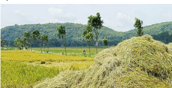
Jakarta Post: November 15, 2020

The government plans to develop food barns and facilitate collaboration between state-owned and Jakarta-owned enterprises to secure rice stocks amid food security challenges due to COVID19 pandemic. (Read more)