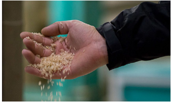
Merco Press: November 12, 2020

Brazil's rice production is expected to shrink and the challenge will be to limit exports in order to supply domestic demand and contain domestic prices. According to the forecast of agricultural production released by the Brazilian Institute of Geography and Statistics (IBGE), the rice crop should have a smaller harvest in 2021. (Read more)