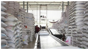
Vietnam Net: November 15, 2020

The ministry will continue cooperating with the relevant ministries and agencies, the Vietnam Food Association and rice traders to develop the market share and promote Vietnamese rice in the EU market and seek new distribution channels. (Read more)